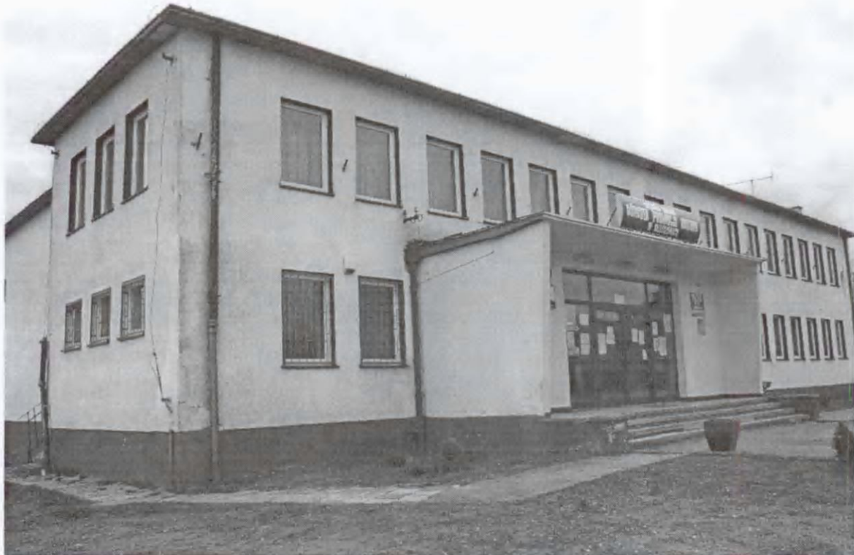
Rys 4. Obecny wygląd MGOPK w Koziegłowach