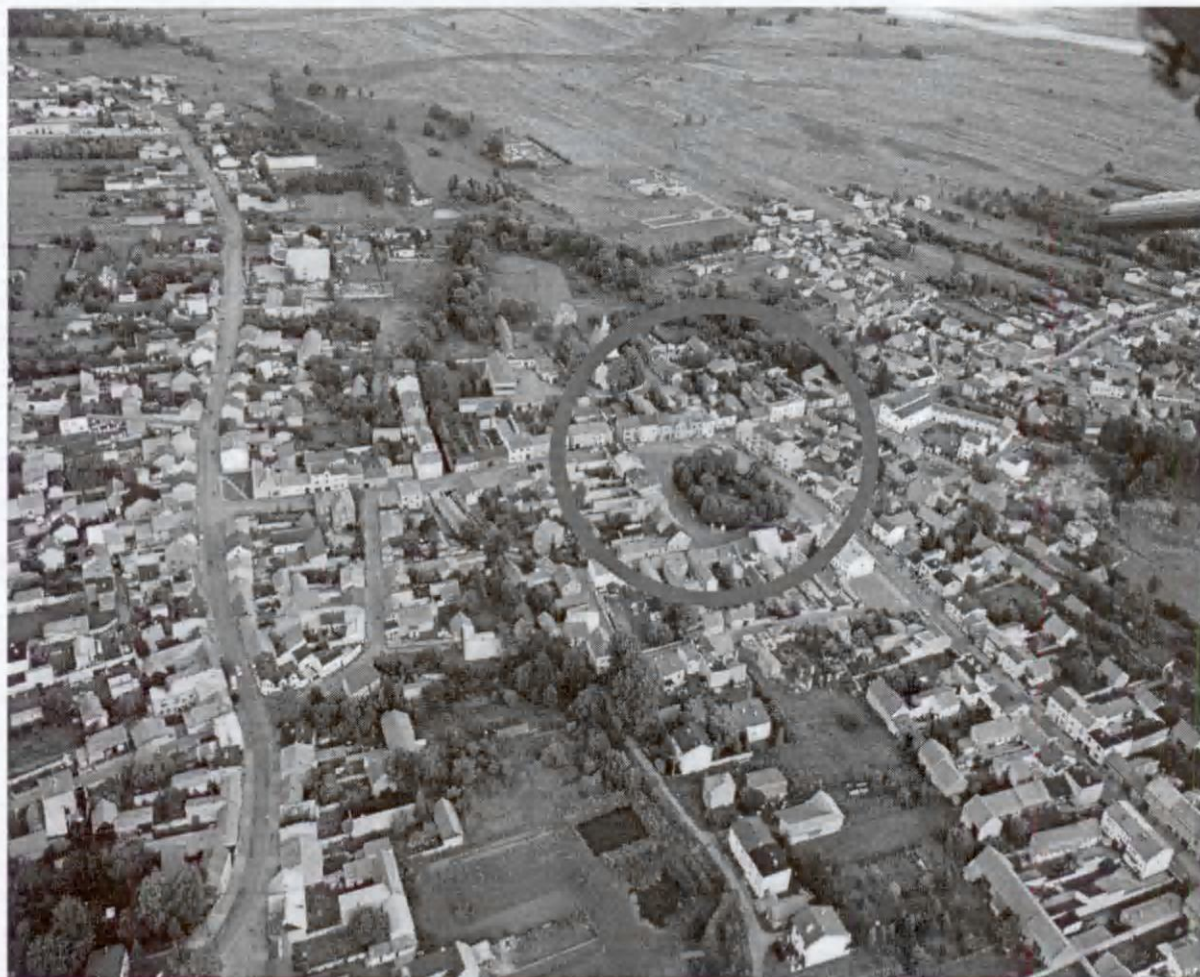
Rys 3. Rynek Koziegłowach z „lotu ptaka”

Do dziś zachował się dawny układ urbanistyczny miasta. W centrum Koziegłów znajduje się czworoboczny rynek z ulicami wybiegającymi z narożników. Jego układ od XIV w. nie uległ znacznym zmianom, różnic dopatrzeć się można jedynie w odnawianych na bieżąco elewacjach budynków. Systematycznym zmianom ulega także architektura roślinna skweru. Oprócz nie naruszonego układu rynku, pozostała część planu przestrzennego miasta ulega nieustannej przebudowie.