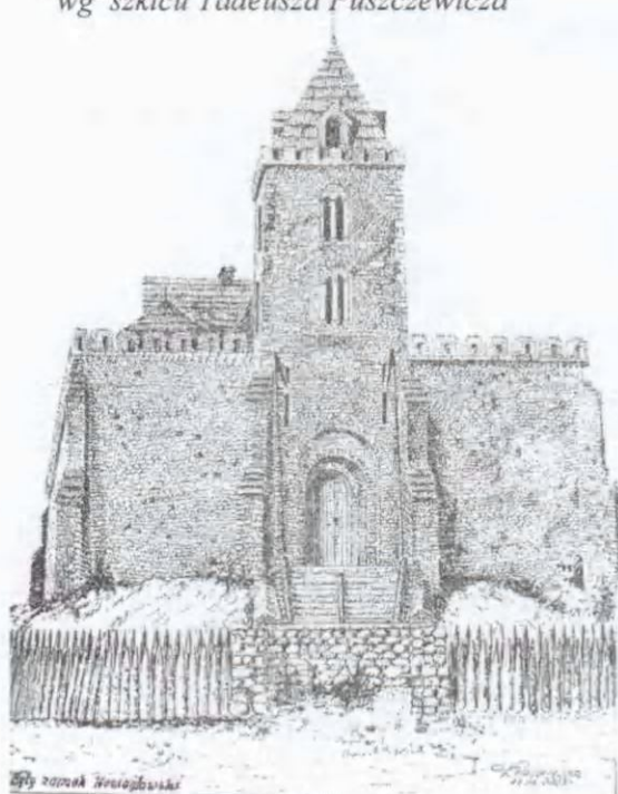
Rys 2. Przepuszczalny wygląd zamku wg szkicu Tadeusza Puszczerwicza

wczesnośredniowiecznej warowni leżącej w punkcie węzłowych połączeń komunikacyjnych (główne szlaki handlowe, przebiegające w owych czasach: z Piotrkowa Trybunalskiego przez Częstochowę, Koziegłowy do Siewierza i Będzina oraz z Opola przez Koziegłowy, Lelów do Krakowa), powstało podgrodowe targowisko. W 1241 r. Koziegłowy doszczętnie zniszczyli Tatarzy. Zamek został zdobyty i częściowo spalony.